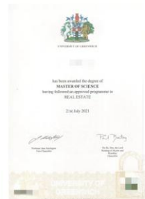
学位证： 房地产专业