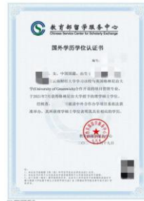
教育部： 学历认证证书