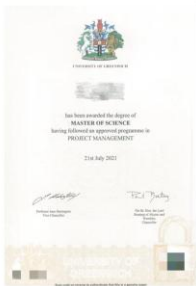
学位证： 项目管理专业